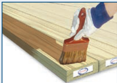
更好的油漆与挂色