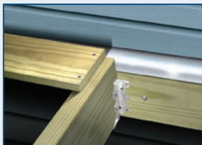
获许与铝直接接触